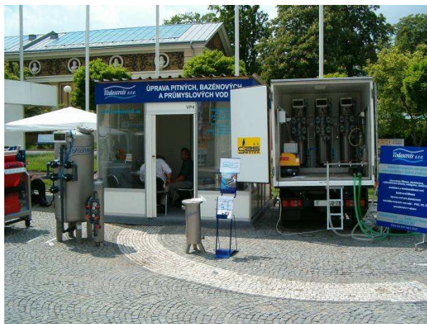
UMUV 1 v malém kontejneru na výstavě