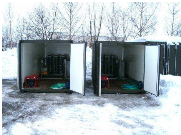
UMUV 1 vyrobené pro Armádu ČR